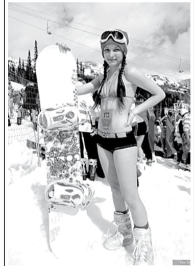
На новогодние праздники Шерегеш посетило рекордное количество человек.

В непростой экономической ситуации население поддержит администрация Кузбасса. Губернатор Аман Тулеев отметил, что «главным подвигом властей в 2015-м» станет со-